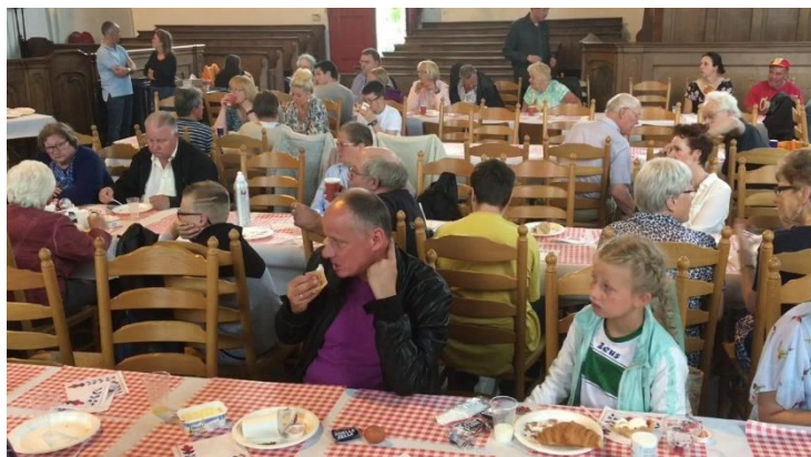
Luilakontbijt in 2017 in de Grote Kerk

Wij vinden het belangrijk dat al onze netwerkpartners op de hoogte zijn van de plannen en deze ook mede willen gaan ondersteunen. Wij hopen met jullie de “eettafel” zoveel mogelijk onder de aandacht te kunnen brengen bij de inwoners van Oostzaan.